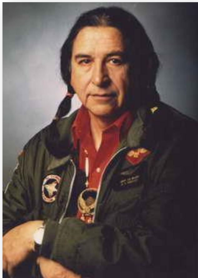
Ed McGaa – Eagle Man, líder ceremonial sioux oglala